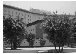
Hospital Nostra Senyora de Meritxell

Faré esment de l'obertura de l'hospital Nostra Senyora de Meritxell, l'any 1994, que va agrupar tots els serveis del CHA en un sol edifici amb una millora de tots els serveis que avui tots coneixem.