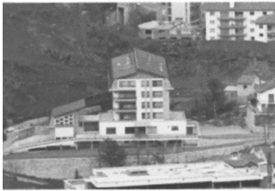
Clínica Verge de Meritxell

L'any 1971 s'inaugura la clínica Verge de Meritxell, com la primera clínica pública i propietat del Consell General. La clínica estava oberta a tots els professionals sanitaris amb autorització d'exercici liberal a Andorra. L'obertura de la clínica va aportar una nova estructura organitzativa i alhora una modernització dels serveis: tres plantes d'hospitalització, urgències, radiologia, farmàcia i quiròfans, entre d'altres. Amb una capacitat de cinquanta llits amb dues habitacions dobles. L'any 1977 s'inaugura la clínica Santa Coloma, propietat de la CASS, amb 55 llits. Les dues clíniques formaren el Centre Hospitalari Andorrà (CHA).