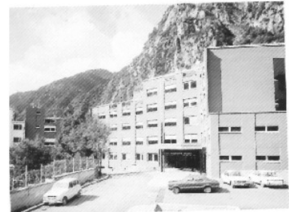
Clínica Santa Coloma

L'objectiu principal d'unificar les dues clíniques en el CHA era per no duplicar serveis i distribuir-los entre els dos edificis: la clínica Verge de Meritxell i la clínica Santa Coloma, per complementar així les activitats assistencials. Els serveis de maternitat i de geriatria van romandre ubicats a la clínica Verge de Meritxell. La resta de serveis ja existents i els de nova creació (unitat de cures intensives, rehabilitació, diàlisi i laboratori) van ser ubicats a la clínica Santa Coloma.